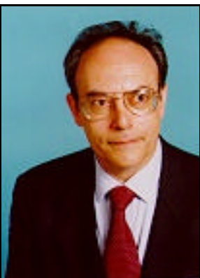
Il Senatore Massimo Villone, Presidente della Commissione Affari Costituzionali del Senato

La scommessa, che molti giudicano temeraria, è quella di trovare un accordo politico su un sistema elettorale da applicare