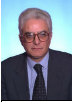
L'On. Sergio Mattarella, considerato il "padre" dell'attuale sistema elettorale

sto di legge, ha posto i confini del ring. Basta astrattezze, insomma. I punti da definire sono, in fondo, abbastanza limitati. Prima di tutto la natura del sistema elettorale. Deve essere un sistema misto, come quello attuale, il v