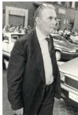
Lo scomparso Onorevole Pinuccio Tatarella, ideatore del sistema elettorale per le Regionali

modello tedesco alla realtà italiana. Ed è qui che nascono i problemi, dato che quasi ogni partito ha avanzato proposte in tal senso. Le più gettonate riguardano