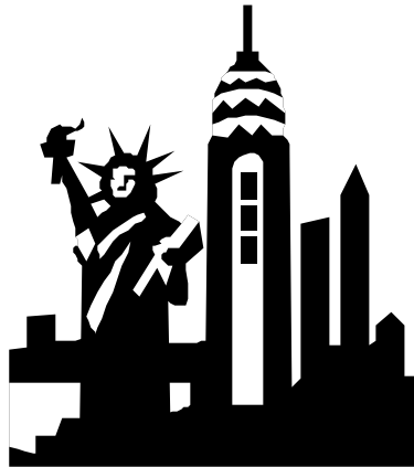
Gli U.S.A. all'attacco nella guerra delle banane.

una levata di scudi protezionista. Stimando il danno apportato alle proprie società di un'entità pari a 520 milioni di dollari annui, per rifondersi della perdita Washington ha stilato una lista di sedici categorie di prodotti non più importabili, tra questi caffè, biscotti, pile elettriche, lampadari, macchine. Per quanto ci riguarda se è vero che i consumatori americani amano l'Italian style, dovranno abituarsi a farne a meno visto il numero dei prodotti italiani presenti nella "lista nera": prosciutto di Parma, Parmigiano Reggiano, i nostri insuperabili rossi di Montalcino e