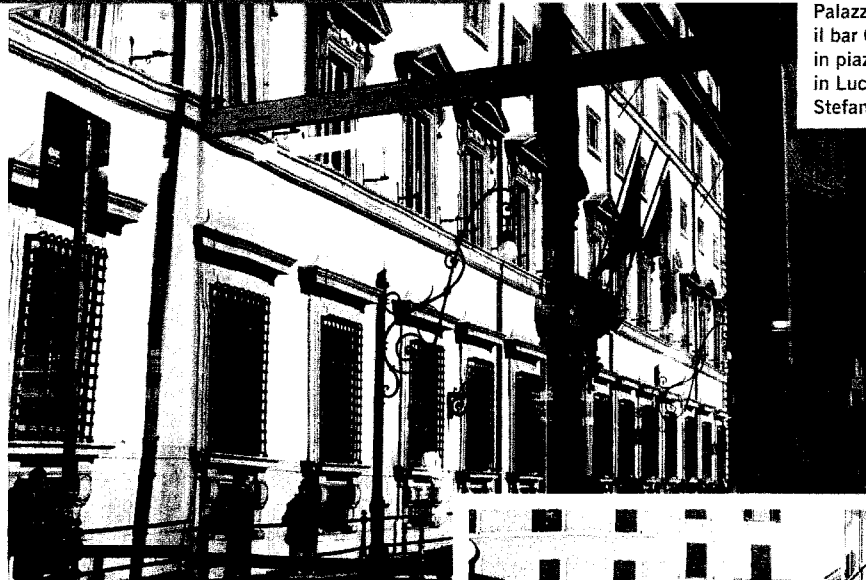
Palazzo Chigi. Sotto: il bar Ciampini in piazza San Lorenzo in Lucina a Roma; Stefano Lucchini