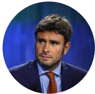
ALESSANDRO DI BATTISTA